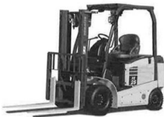
カウンターバランスフォークリフト