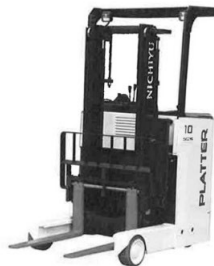
リーチフォークリフト