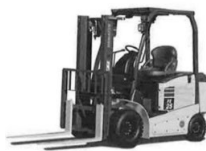
カウンターバランスフォークリフト