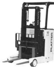
リーチフォークリフト