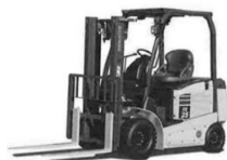
カウンターバランスフォークリフト